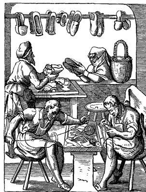
Producten die overeenkomstig de normen van de gilde zijn gemaakt, worden voorzien van kleine loden garantiezegels

Het zijn in de zeventiende eeuw vooral de gilden die de sociale en economische orde in de steden handhaven. Ze hebben het alleenrecht op de handel in hun branche, daartoe gemachtigd door het stadsbestuur. Gilden leggen hun leden werkmethoden en vormen van kwaliteitscontrole op, soms ook vaste prijzen. Ze beschermen tot op zekere hoogte ook de consument, namelijk tegen bedrog en klunzig werk van een lid dat zijn vak niet goed verstaat. Het handhaven van al die regels en het behandelen van consumentenklachten komt vooral neer op de vindere s of oudermannen , de bestuurders van de gilde. Hun benoeming behoeft de goedkeuring van het stadsbestuur. Dat geldt ook voor de reglementen van de gilde. 5