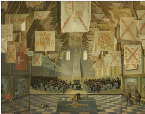
Vergaderzaal van de Staten-Generaal (Ridderzaal)

voerd tussen de steden, de provincies en de Staten-Generaal. Men probeert de interne verschillen door discussie, bemiddeling en het sluiten van compromissen te overbruggen. De overheid treedt structurerend op, maar laat vooral veel ruimte aan het initiatief van particulieren en instellingen. De politieke cultuur in de Republiek vertoont zo al kenmerken van het hedendaagse poldermodel, waarin consultatie en dialoog centraal staan. 7 De voorzichtige opstelling van Hof en Staten van Holland bij het afwikkelen van de tulpenmanie is daar een goed voorbeeld van.