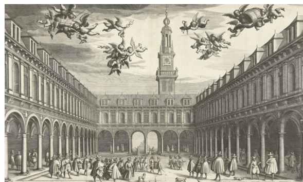
Beurs van Amsterdam

Een deel van de tulpenhandel ontaardt eind 1636 in windhandel, een papieren gokspel. Feitelijke levering van de bollen wordt niet meer verwacht, zowel door koper als verkoper. Het lijkt op de situatie bij de Amsterdamse beurs, waar het al vanaf 1612 verboden was om niet-bestaande aandelen te verkopen, dat wil zeggen aandelen die niet op de eigen naam geregistreerd staan. Zulke contracten zijn niet alleen nietig, maar zo’n verkoper ontvangt een stevige boete. 4 Alle andere speculatieve investeringen op de aandelenbeurs – en dat zijn er nogal wat – zijn daarentegen volledig toegestaan. De juridische benadering van dit soort contracten is in de jaren 1630 nog niet uitgekristalliseerd; niet in de tulpenhandel, noch daarbuiten.