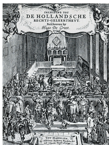
Hugo de Groot bracht in 1632 als eerste het Hollandse recht in kaart

vonden. Soms beriepen tulpenkopers en hun borgen zich achteraf op onwetendheid: 'We wisten eigenlijk niks van de bloemen, of van de waarde daarvan.' Onwetendheid van de koper lijkt voor de rechter in de Gouden Eeuw geen excuus om niet voor de tulpenbollen te hoeven betalen. Omgekeerd, zo wordt beweerd, moet een vakman instaan voor zijn product: professio artis oblige , wie ook de koper is. Verkoopt men iets met een verborgen gebrek, dan mag je achteraf niet stellen dat gebrek niet te kennen. Maar als rechtsbeginsel was dit toen nog niet algemeen aanvaard. 13 Of er bij een tulpenzaak ooit een beroep op is gedaan, is mij (nog) niet bekend. In beide gevallen van onwetendheid werd het niet goed nakomen van het contract beschouwd als het beschamen van eer en vertrouwen.