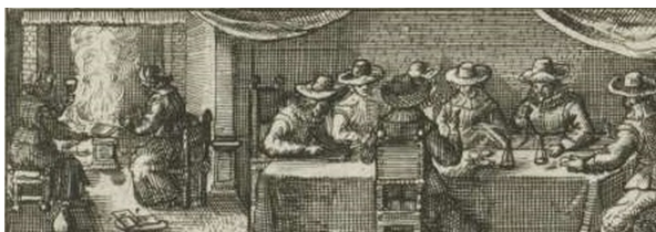
De collegie kan regels opstellen voor de verkoop in de herberg. Een gekozen secretaris houdt de transacties bij (fragment van Florae Mallewagen)

De rituelen in de herbergen maakten van de tulpenhandel een ‘parodie op de beurshandel’. 3 Een parodie voor mensen die het zich niet konden veroorloven om op de beurs aandelen te kopen.